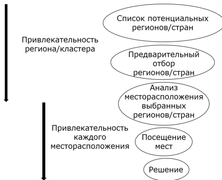
Рис. 3. Схема процесса принятия инвестиционного решения