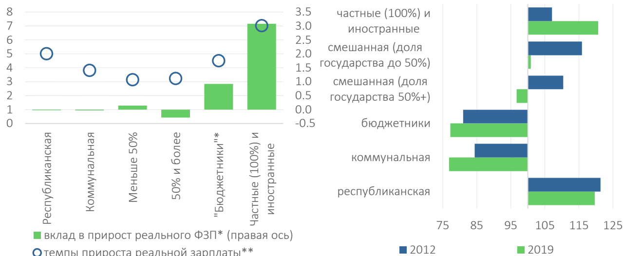
Рис. 3. Среднегодовые темпы прироста реальной зарплаты и вклад в прирост реального ФЗП (график слева), зарплата на предприятиях разной формы собственности, % от средней зарплаты (график справа)

* вклад в прирост фонда заработной платы (ФЗП) в реальном выражении; ФЗП рассчитывался как произведение средней зарплаты на списочную численность в среднем за период.