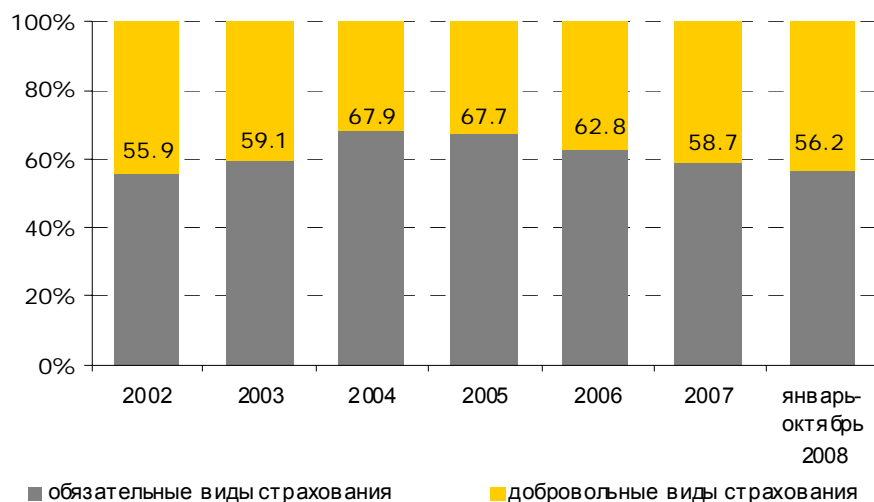
Рис.3. Удельный вес обязательного/добровольного страхования в общей сумме страховых взносов, %