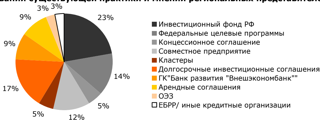
Рис. 2. Инструменты ГЧП, фактически используемые в регионе ЦФО (на основании существующей практики и мнений региональных представителей)